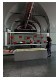
Render di una sala del museo

TORNANDO nella navata ovest si entra nella sezione della «Primavera dei Popoli»: si raccontano i moti insurrezionali fra il 1848 e il 1870: in grandi teche vetrate e illuminate dall'interno sono allineate armi, uniformi e busti dei protagonisti del tempo. Di lì ecco una delle sezioni più importanti del museo, dedicata alle guerre risorgimentali e alle 10 giornate di Brescia. L'ultima camera di pilastri della navata centrale è occupata da un volume chiuso, rivestito all'esterno di specchio, all'interno contiene l'installazione immersiva che consente di vivere la rivolta del