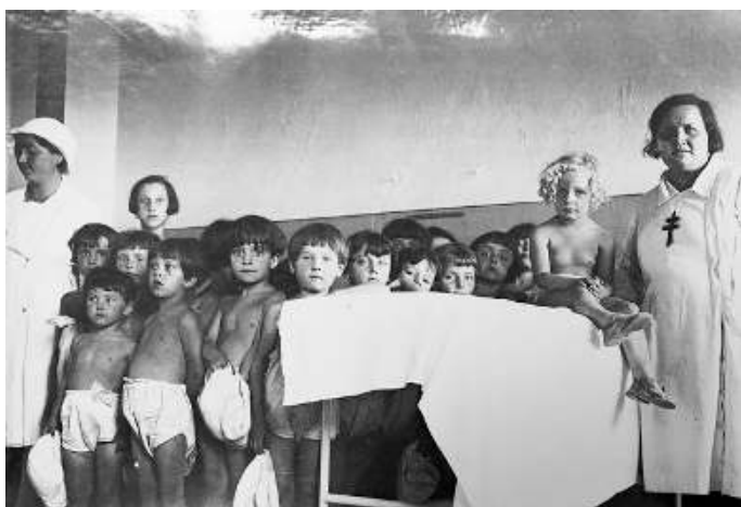
In infermeria. Bambini alla colonia del Castello

Nella visione militarista e salutista del regime una grande attenzione venne riservata al corpo