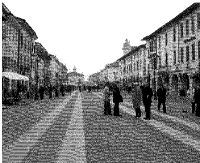
A Orzinuovi percorreva la piazza con passo svelto verso la chiesa