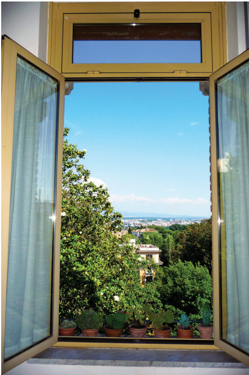
panorama oggi ridotto, a causa della crescita di una maestosa magnolia

Per tutto questo e ben altro di lui, nell'Ordine dei Barnabiti, tra i suoi familiari, come anche nel campo scientifico e accademico che non a caso ha voluto organizzare questa opportuna iniziativa, se ne avverte vieppiù la sincera mancanza.